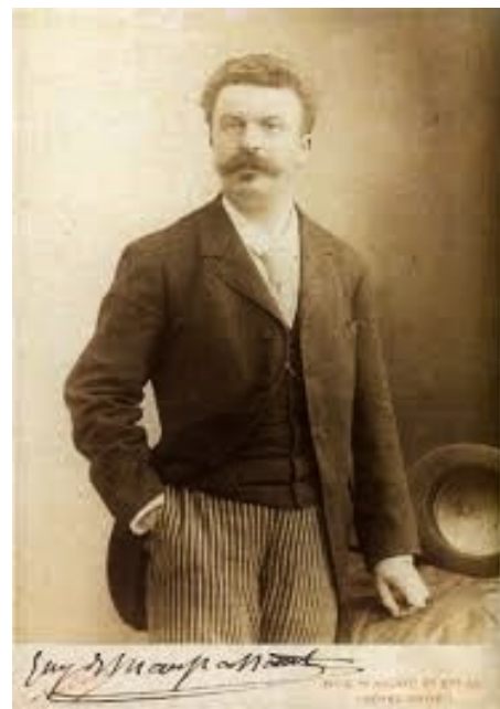
Guy de Maupassant