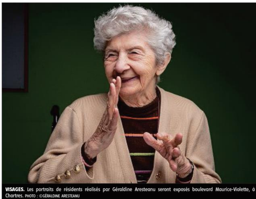
VISAGES. Les portraits de résidents réalisés par Géraldine Aresteau seront exposés boulevard Maurice-Violette, à Chartres.

« Nous répétions le matin et nous propositions des ateliers avec eux l'après-midi, explique Sylvia Bruyant, metteuse en scène et scénariste. Nous avons beaucoup échangé avec les rési-