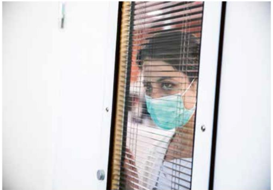
| Une photo extraite de « 24 heures en réa »