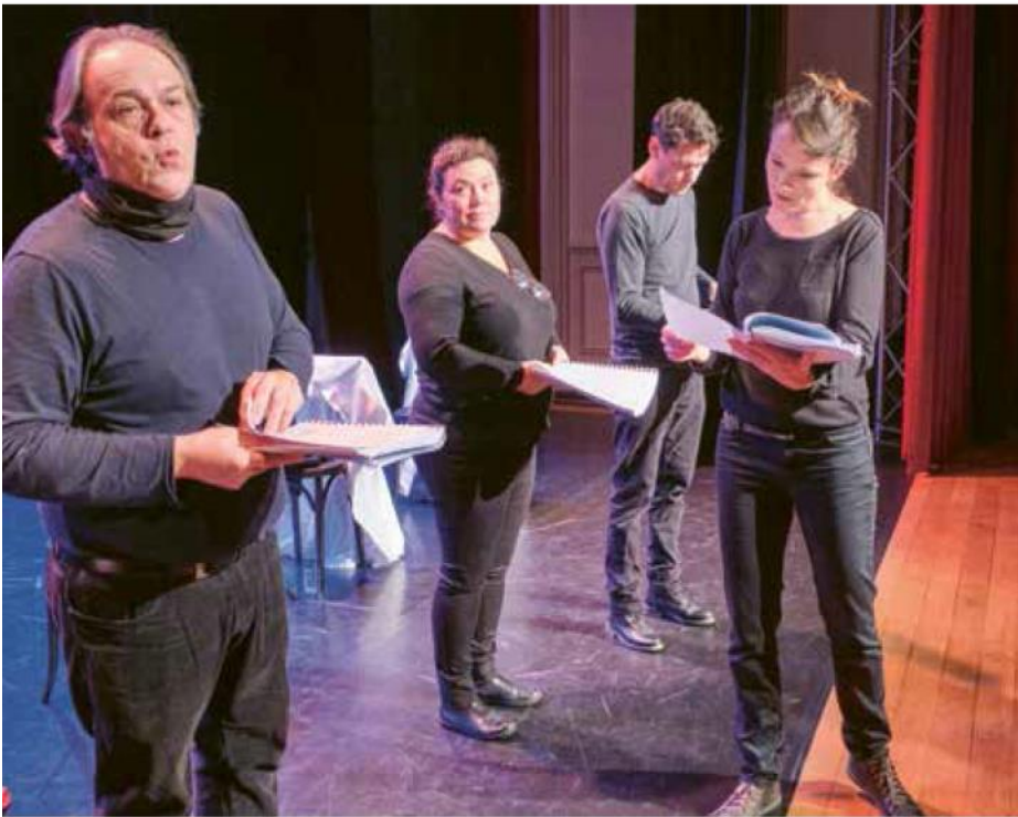
Les comédiens de la compagnie Cavalcade lors de la captation de la lecture de Bienvenue au Bel Automne en décembre au Théâtre