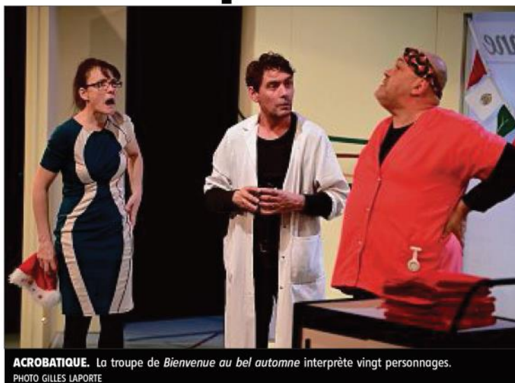
ACROBATIQUE. La troupe de Bienvenue au bel automne interprète vingt personnages.

La dramaturge de la compagnie Cavalcade, de son propre aveu, « vit, mange et dort avec ce texte » depuis dix-huit mois. Après une longue préparation et une interruption due à la pandémie de coronavirus, la comédienne et sa troupe sont prêts à présenter la grande première de la pièce au pu-