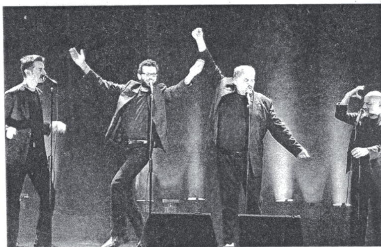
Le spectacle des Frères Brothers a fait mouche.

Les quelques 200 spectateurs présents ne boudaient pas leur plaisir, participant volontiers au spectacle aussi souvent que les artistes les invitaient à le faire, reprenant no-