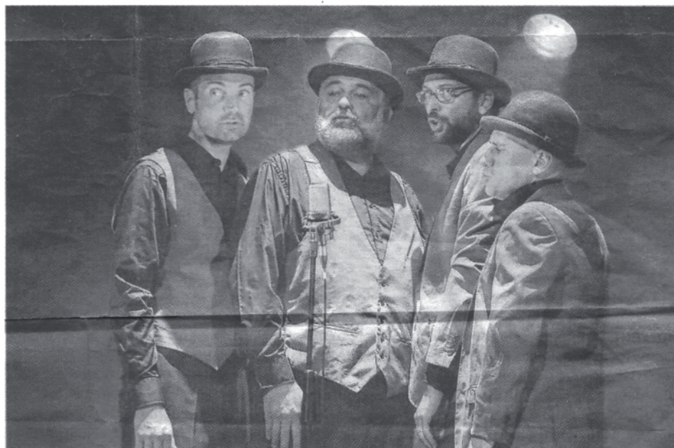
Les Frères brothers, quatre virtuoses du chant, au service de l'humour.