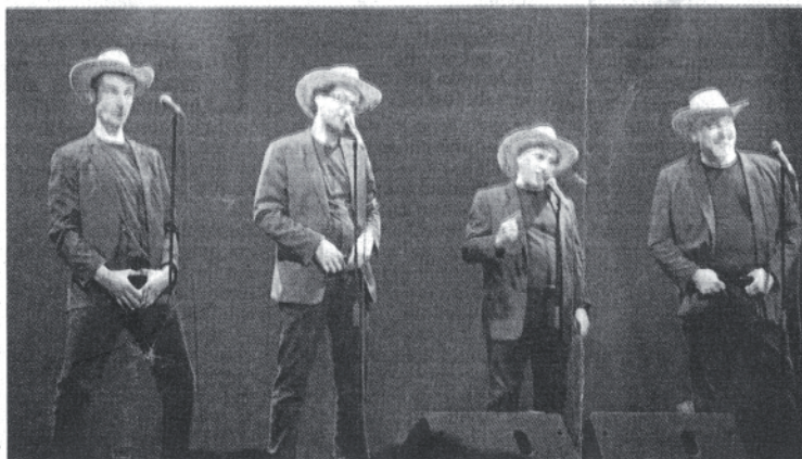
Les Frères devenus Friends, amoureux du travail vocal harmonisé.

Quatre tessitures à l'unisson parfait qui se paient le renfort de bruitages confondants de réalisme, c'est déjà bien parti, mais ce n'est qu'une manière d'introduction pour les « Frères Frères », remarquables fantaisistes, mimes, acteurs pour qui les onomatopées du swing ne suffisent pas : car entre les intermèdes décalés et jubilatoires – le groupe prend le public en photo, promettant de la diffuser sur Facebook... ces « Frères devenus Friends » passent en revue les thèmes sensibles de l'époque, avec un humour vache qui ne confine jamais au vitriol, mais incline à la franche rigolade. Ah ! la mise en abîme de ces groupes dont la vocation préten-