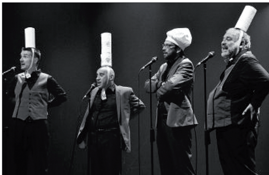
TABLEAUX. Les Frères Brothers, parrains du festival Drôles Deuchansons .

De la messe de Noël, de Marcelle qui rêve d'île Maurice et qui va mourir à Sarcelles, de « Grand corbillard » qui s'avance