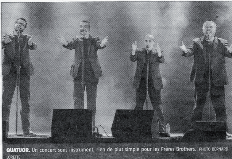
QUATUOR. Un concert sans instrument, rien de plus simple pour les Frères Brothers.

Dans le noir montent les premières harmonies vocales. Les doigts claquent en mesure, soutenant le rythme. Les voix s'élèvent surprenantes. Mais le nom du groupe en forme de pléonasme franco-anglais laisse à penser que le côté cérémonieux de l'intro va appeler d'autres cadences. Soudain, la fête éclate, folle, débridée. C'est le départ d'un singulier voyage ; a cappella justement, du carnaval de Venise aux canyons de l'Arizona, de Munich aux cimes de l'Himalaya. Avec une virtuosité affirmée les quatre garçons miment tout un orchestre. Les voix sont